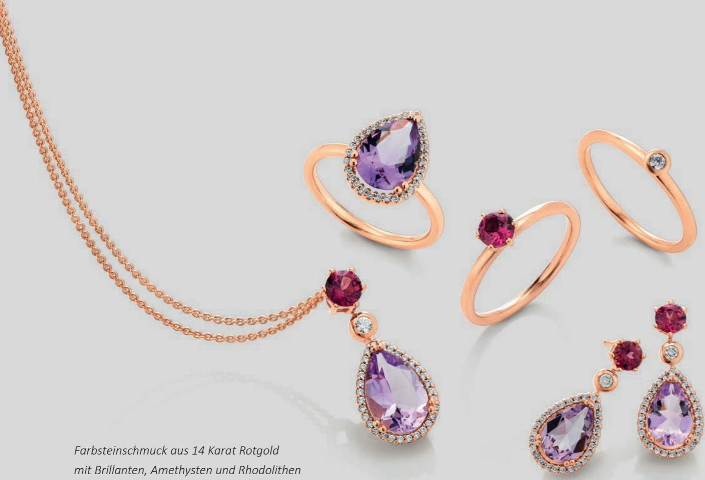
Farbsteinschmuck aus 14 Karat Rotgold mit Brillanten, Amethysten und Rhodolithen