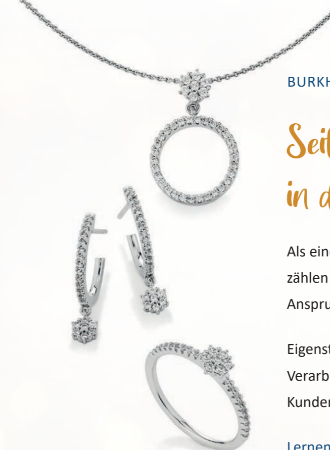
Brillantschmuck aus 14 Karat Weißgold