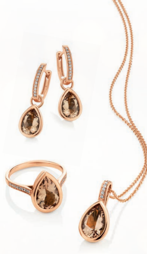
Farbsteinschmuck aus 14 Karat Rotgold mit Brillanten und Morganiten

Fortschrittliches Denken in allen Unternehmensbereichen, hervorragende Marktkenntnisse und ein Gespür für die Bedürfnisse des internationalen Schmuckkäufers waren und sind ausschlaggebend für unseren Erfolg.