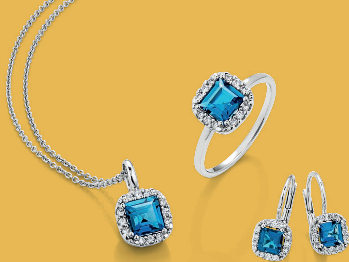
Farbsteinschmuck aus 14 Karat Weißgold mit Brillanten und Blautopas London Blue