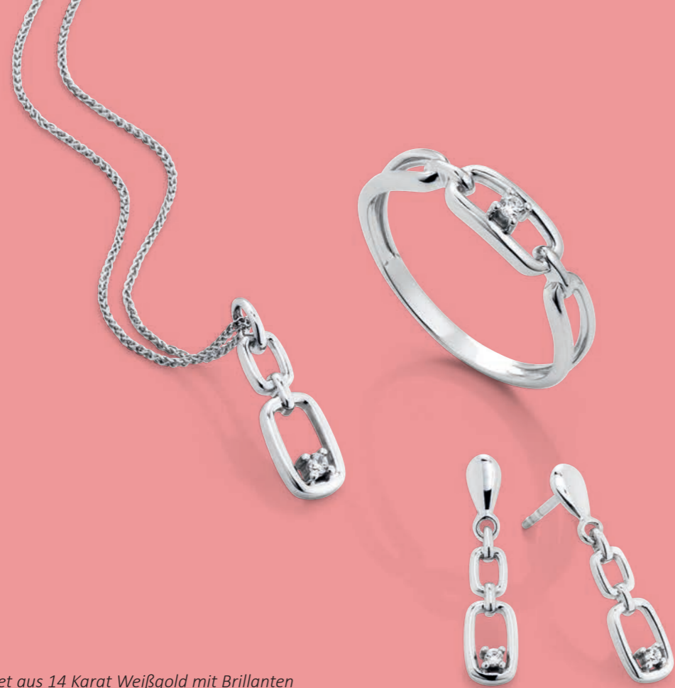
Schmuckset aus 14 Karat Weißgold mit Brillanten